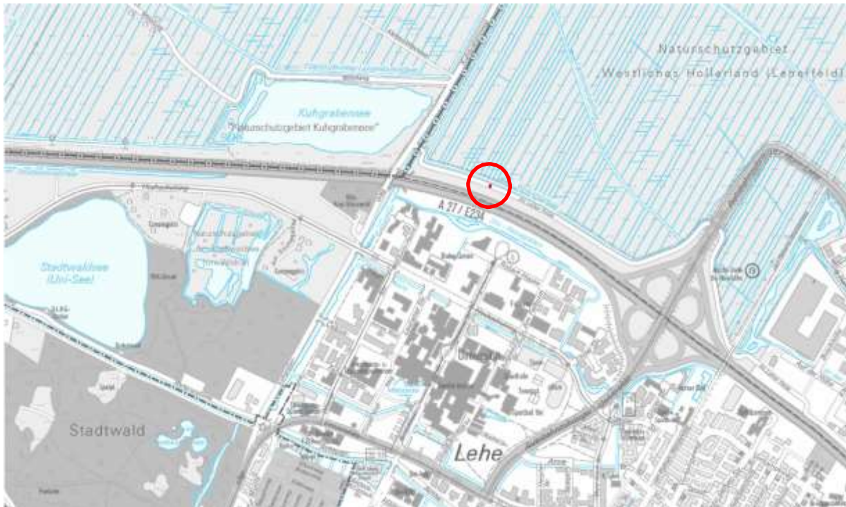
Stadtplan 1: 20 000