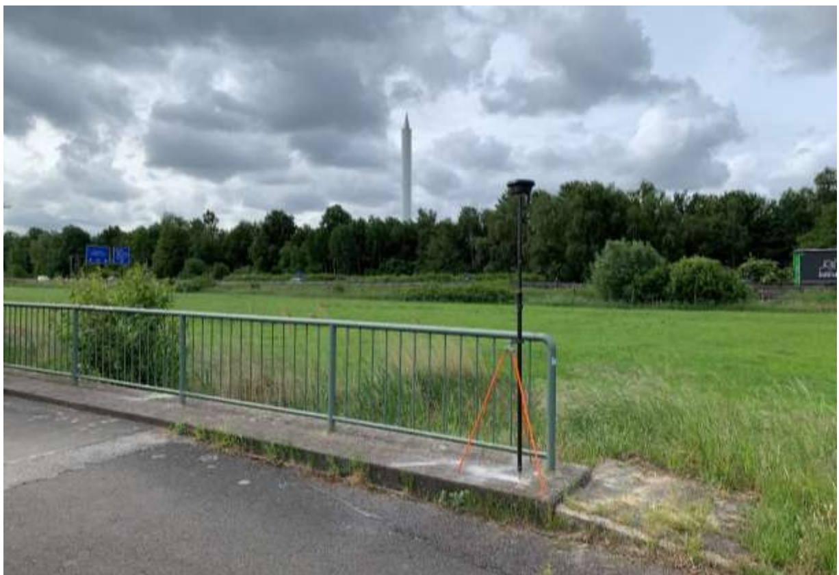
Blickrichtung Fallturm / A27